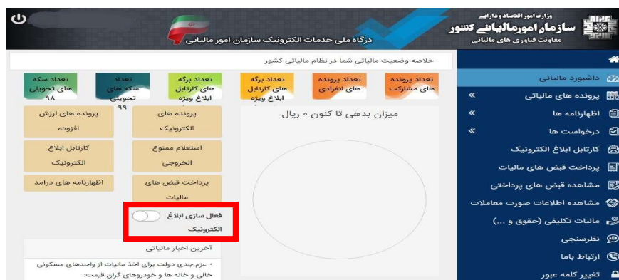
شکل شماره ۲