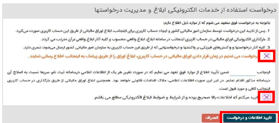
شکل شماره ۳

پس از کلیک بر روی دکمه "فعال سازی ابلاغ الکترونیک، (شکل شماره ۲)، برگه "درخواست استفاده خدمات الکترونیکی ابلاغ و مدیریت درخواستها" (شکل شماره ۳) برای شما باز می شود. با فشردن گزینه های ذیل و تایید آن، ابلاغ الکترونیک برای شما فعال شده و اوراق مالیاتی که از این تاریخ به بعد صادر می شوند در "کارتابل ابلاغ الکترونیک" (شکل شماره ۴) شما قرار خواهند گرفت.